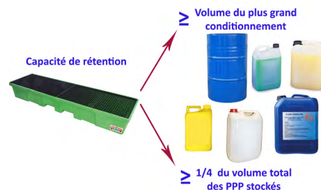
Exemple de dépôt assurant une rétention efficace ▼