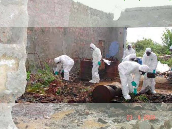
Décontamination d'un site pollué par des PPP ▼

Cette mesure concerne la mise en œuvre de l'arrêté du Gouvernement wallon déterminant les conditions intégrales relatives aux dépôts de PPP à usage professionnel de classe 3 (lorsque la quantité stockée est égale ou supérieure à 25 kg et inférieure à 5 t).